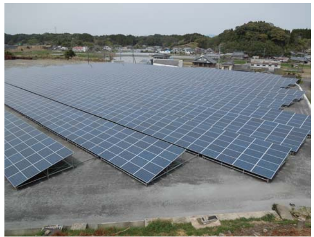
トレップ TT-130B (厚さ 0.5 mm) タイプを全面敷設