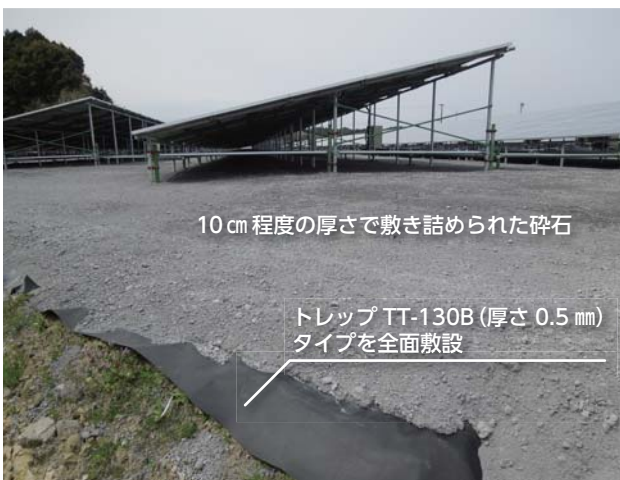
10 cm 程度の厚さで敷き詰められた碎石