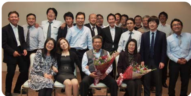
関西営業部の皆さん