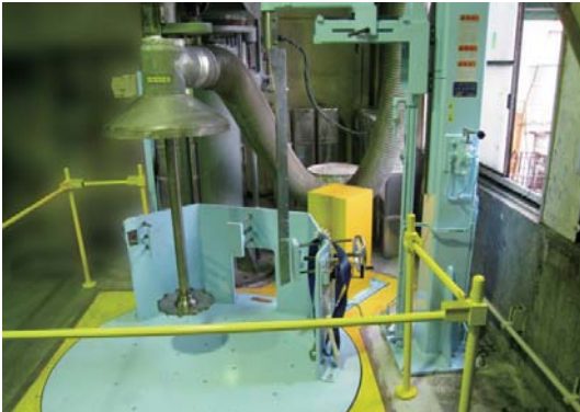
ターンテーブル付攪拌機